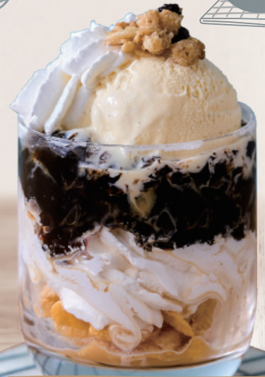
グラスコーヒーゼリーパフェ 500円(税込550円)