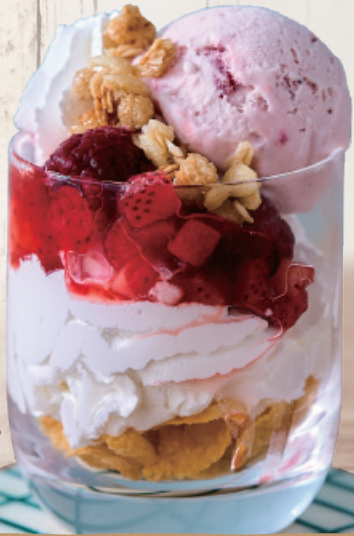
グラスいちごパフェ 500円(税込550円)