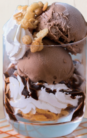
グラスチョコパフェ 500円(税込550円)