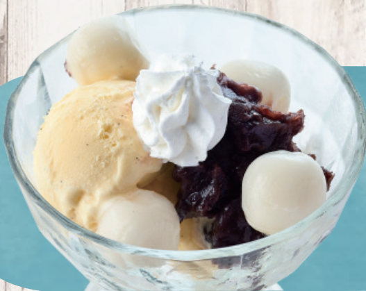
白玉クリームあずき 410円(税込450円)